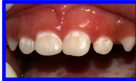
Tach blan ak kari byen bone