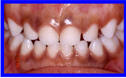
Dan ki an